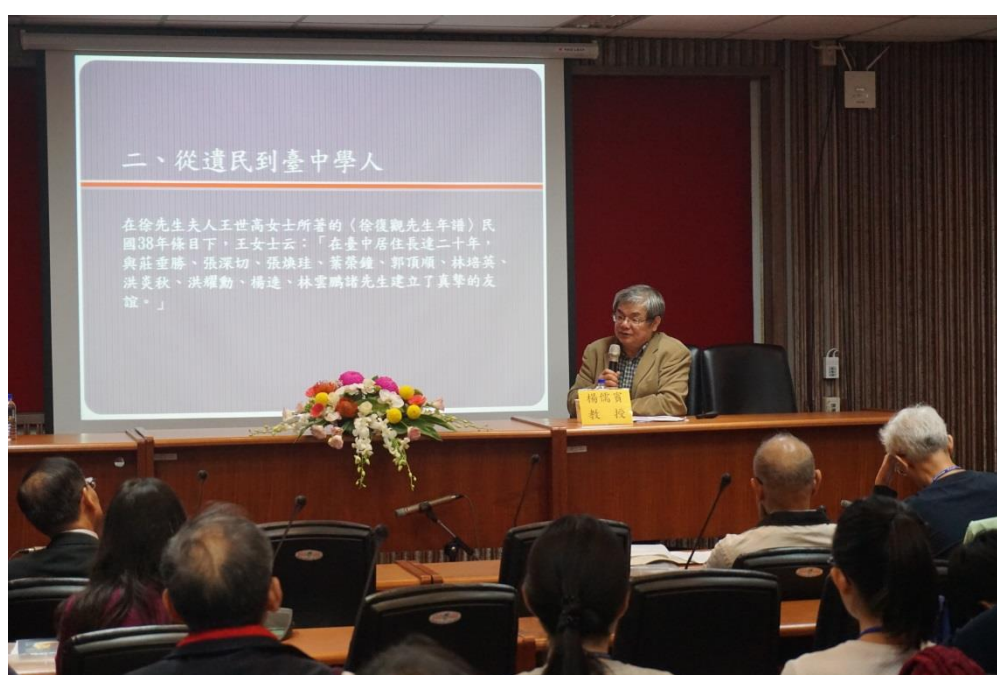
清華大學中文系楊儒賓講座教授進行專題演講：徐復觀與台中學人

東海大學圖書館、中國文學系於 12 月 3 日，假東海大學良鑑廳舉行「文學·思想·藝術—徐復觀先生學術論壇暨東海大學圖書館典藏徐復觀先生手稿整理計畫成果發表會」，以論壇的形式，探論徐復觀先生的學思歷程與學術成就，以及徐先生研究的可能方向。並藉此機會，發表「東海大學徐復觀先生手稿整理計畫」成果。當天的論壇中，與會學者各就其專長與對徐先生研究的關注，進行專題講演、和主題討論與圓桌會談。